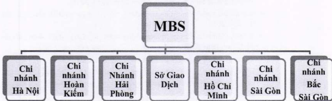
Hình 4: Mạng lưới của công ty.